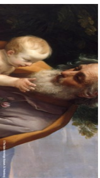
ALZATI, PRENDI CON TE IL BAMBINO E SUA MADRE Mt 2,13

Padre amato. Per il particolare ruolo che ha avuto, prendendosi cura da sposo e da padre di Maria e Gesù, il papa ricorda che san Giuseppe è stato sempre molto amato dal popolo cristiano e la devozione ha avuto espressioni particolari nel giorno del mercoledì di ogni settimana, in occasione della festa liturgica il 19 marzo, nella celebrazione della novena e del mese di san Giuseppe. Tra i suoi appassionati devoti si distinse santa Teresa d'Avila. Nella sua "Autobiografia" scrisse: «Non mi ricordo finora di averlo mai pregato di una grazia senza averla subito ottenuta».